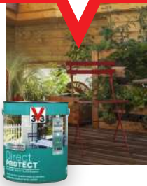
PEINTURE MULTI-MATÉRIEAUX V33 DIRECT PROTECT 2,5L

sur les teintes Incolore, Chêne clair, Chêne Doré, Chêne moyen, Chêne foncé, Pin scandinave, Naturel