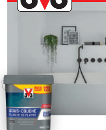
SOUS COUCHE PLAQUE DE PLÂTRE V33 BLANC MAT 12L